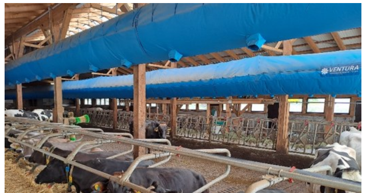
Schlauchlüftung: Tubes werden individuell berechnet und an den Stall angepasst

Die warme Zeit ist für Kühe sehr herausfordernd. Mit gezielten Maßnahmen können sie ihre Tiere unterstützen, gesund und damit leistungsfähig zu bleiben.