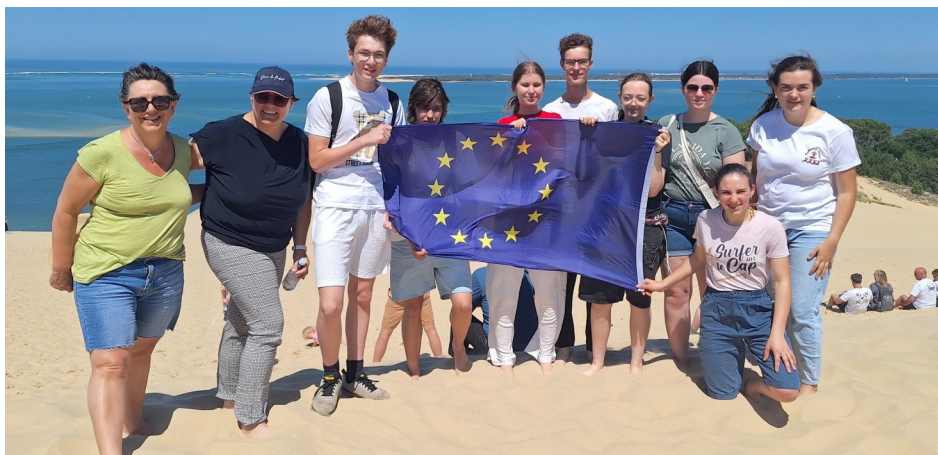
Unsere Schülerinnen und Schüler konnten in ihre Füße in den Atlantik tauchen und die größte Wanderdüne Europas, die Dune du Pilat am Bassin d'Arcachon, erklimmen.

Auch der Gourmetabend der 1. Klasse war ein besonderes Ereignis. Die Eltern waren eingeladen und konnten erleben, was ihre Töchter und Söhne bereits im ersten Ausbildungsjahr gelernt haben. Mit großem Einsatz und viel Kreativität präsentierten die Jugendlichen ihr Können und sorgten für einen gelungenen Abend.