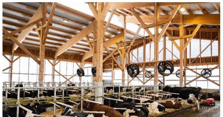
Ventilatoren müssen passend positioniert werden