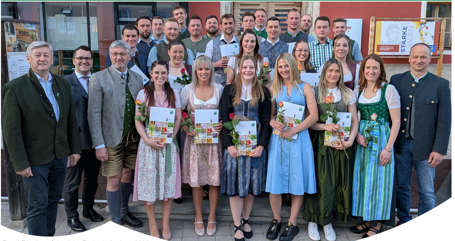
der erfolgreiche Facharbeiterkurs 2026 im Schloss Feistritz samt Gratulanten in Murau (siehe Seite 29)

Bezirkskammer für Land- und Forstwirtschaft murau