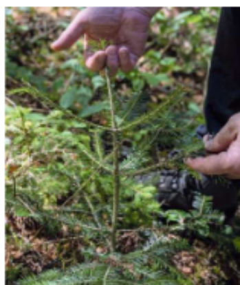
Im ausgelichteten Fichtenwald gehen Tannenpflanzen auf