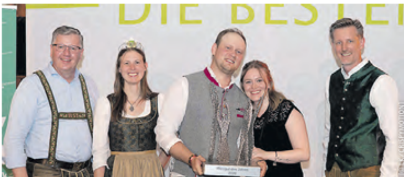
Die Freude über die Auszeichnung zum „Weingut des Jahres“ 2026 war groß.