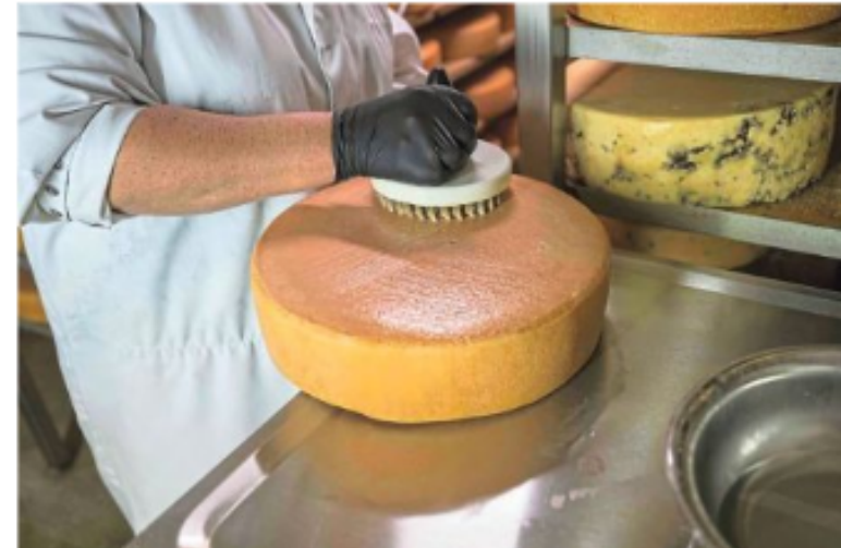
Bis so ein Käse Gaumenfreude wird, braucht er viel Pflege