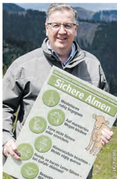
Andreas Steinegger mit sechs zentralen Verhaltensregeln.

Die heurige Almsaison hat bereits begonnen. Etwa 50.000 Weidetiere, davon rund 42.000 Rinder, werden die nächsten Monate auf den rund 1600 steirischen Almen verbringen. „Damit die Alm- und Weidesaison möglichst ohne tragische Unfälle verläuft, braucht es Rücksicht und Respekt gegenüber den Weidetieren sowie die Einhaltung der Verhaltensregeln. Denn Almen und Weiden sind kein Streichelzoo“, unterstreicht LK-Präsident Andreas Steinegger. Er weist auf die zentralen Verhaltensregeln hin: „Weidetieren soll man ruhig begegnen. Man soll auf markierten Wegen bleiben und Tiere nicht füttern oder streicheln.“ Weiters appelliert er, die Hinweistafeln zu beachten und Hunde bei einer Begegnung mit Tieren an kurzer Leine zu führen. Ergänzend fügt er aber hinzu: „Bei Gefahr sofort ableinen!“ Oberstes