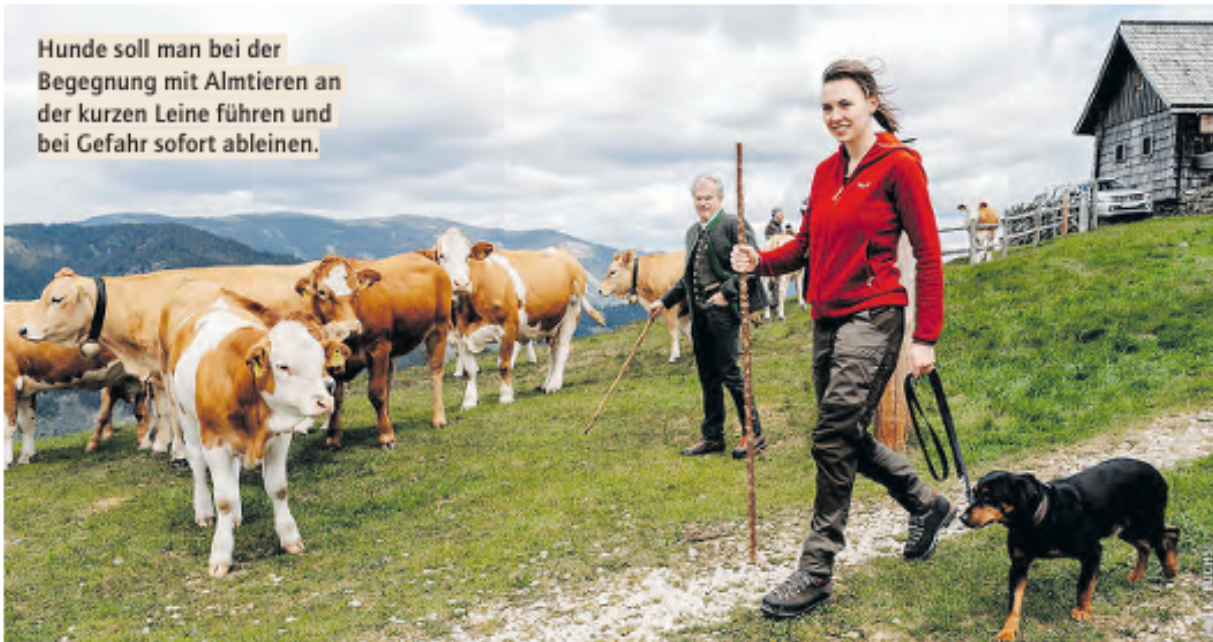
Hunde soll man bei der Begegnung mit Almtieren an der kurzen Leine führen und bei Gefahr sofort ableinen.