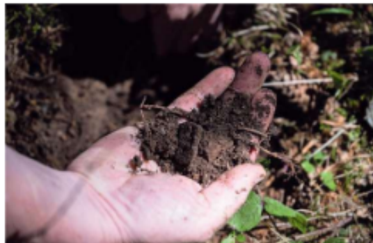
Feuchtes Erdreich trotz allgemeiner Trockenheit