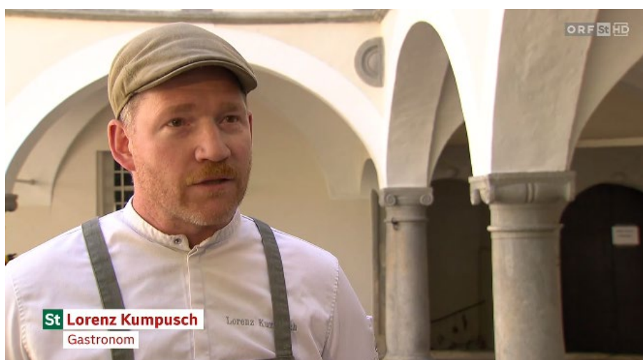
St Lorenz Kumpusch Gastronom