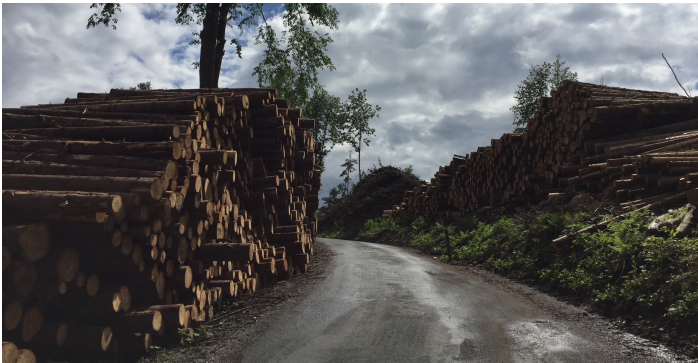
Waldlager mit Sägerundholz aus dem Winter prägen das Bild im II. Quartal

Die österreichische Sägeindustrie ist sehr gut mit Nadel-sägerundholz bevorratet , die Nachfrage ist angesichts der angespannten gesamtwirtschaftlichen Situation sowie einer starken Erntesaison entsprechend gedämpft. Sich füllende Schnittholzlager und der aufgrund der Kriegshandlungen nahezu zum Erliegen gekommene Schnittholz-Warenstrom Richtung Nahen Osten prägen die Situation. Streng kontingentierte Zulieferung , lange Straßensperren, fehlende Frachtkapazitäten sowie Probleme bei der Waggonbereitstellung beeinträchtigten den Abtransport bzw. führten im März und April zu rasch steigenden Waldlagerständen.