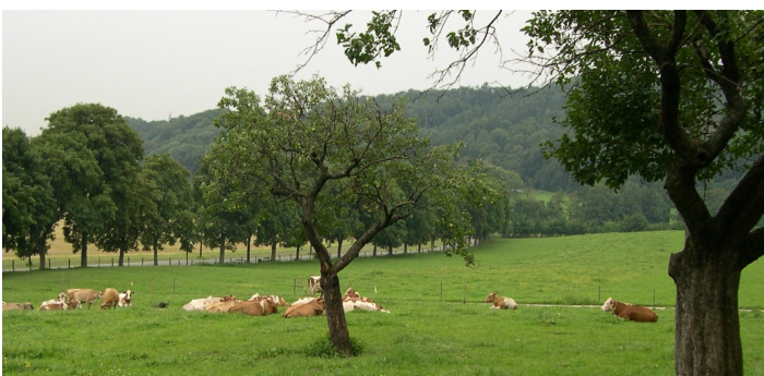
Die Weidehaltung ist ein zentrales Element einer artgerechten Tierhaltung in der Biolandwirtschaft

Diese Übergangslösung ist ein positives politisches Signal: Die Umstellung auf Bio-Landwirtschaft ist erwünscht und wird auch unterstützt. Die aktuellen Marktdaten zeigen: Bio-Einkäufe in Österreich stiegen 2025 wertmäßig um 2,3 Prozent und mengenmäßig um 6,5 Prozent. Der wertmäßige Bioanteil im gesamten Lebensmitteleinzelhandel betrug 12 Prozent. Speziell die Geflügelbranche sucht Bio-Mast- und Bio-Legehennen-Betriebe, aber auch in den Bereichen Bioschweinehaltung und Bio-Rindfleisch übersteigt die Nachfrage das Angebot. In Österreich wirtschaften aktuell rund 23 Prozent der landwirtschaftlichen Betriebe biologisch, sie bewirtschaften etwa 27 Prozent der Nutzfläche. Insgesamt gibt es in Österreich rund 23.500 Bio-Höfe mit knapp 690.000 Hektar Biofläche. In der Steiermark bearbeiten 3.948 Bio-Betriebe rund 85.000 Hektar Bio-Flächen.