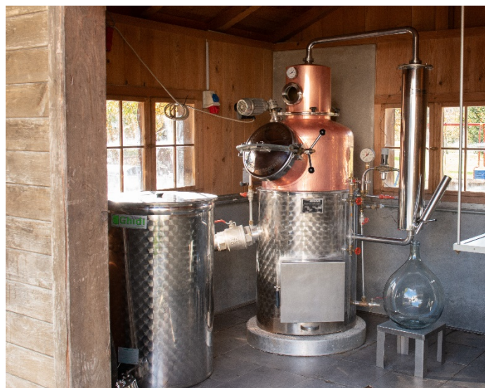
Bild 2: Beim Zollamt Österreich muss ein Antrag auf Zulassung eines einfachen Brenngerätes gestellt werden.

Der Antrag auf Zulassung eines einfachen Brenngerätes ist schriftlich vom/von der Eigentümer:in beim Zollamt Österreich einzubringen. Der Antrag hat Name und Anschrift der Antragstellerin bzw. des Antragstellers und den Aufbewahrungsort zu enthalten. Des Weiteren sind ein Aufriss, eine Beschreibung des einfachen