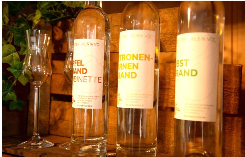
Bild 1: Zur Herstellung von Alkohol unter Abfindung werden selbstgewonnene alkoholbildende Stoffe auf einem zugelassenen einfachen Brenngerät verarbeitet.

Grundlage für die Alkoholbesteuerung ist das Alkoholsteuergesetz 2022 (AlkStG 2022). Der Alkoholsteuer unterliegen Alkohol und alkoholhaltige Erzeugnisse, die im Steuergebiet hergestellt oder in das Steuergebiet eingebracht werden. Steuergebiet ist das gesamte Bundesgebiet mit Ausnahme der Gemeinden Jungholz (Tirol) und Mittelberg (Vorarlberg).