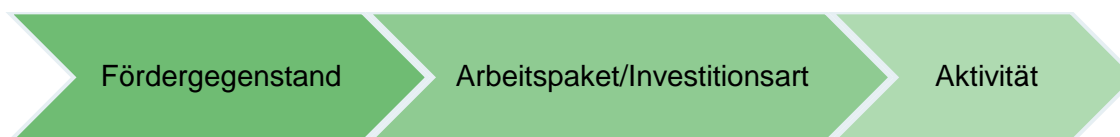
Abbildung 2: Ebenen des Projektinhalts

Die Darstellung des Projektinhalts gliedert sich in 3 Ebenen. Nach der Auswahl des Fördergegenstandes wird auf nächster Ebene das Arbeitspaket/die Investitionsart abgefragt. Auf der Ebene Arbeitspaket/Investitionsart müssen die Aktivitäten auf dritter Ebene ausgewählt werden.