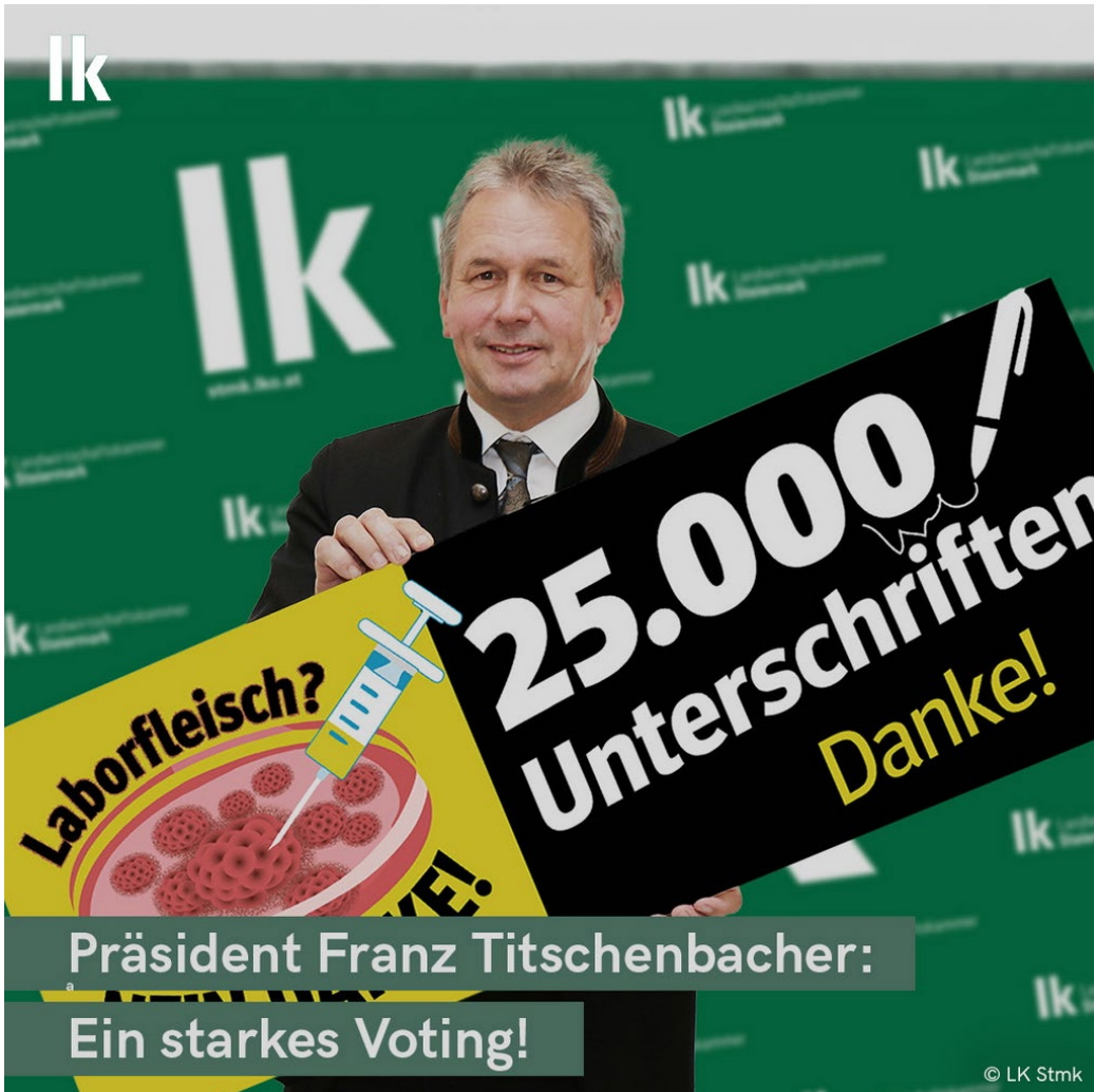
Präsident Franz Titschenbacher: Ein starkes Voting!