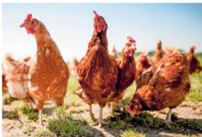
Viele Betriebe müssen ihr Geflügel nun im Stall halten

ANTWORT: Theoretisch ja – in Europa sind bisher aber keine Fälle bekannt. Laut Ages gab es aber einzelne Erkrankungen bei Menschen auf anderen Kontinenten, die eng mit den Tieren zusammenleben oder arbeiten. Eine Übertragung zwischen Menschen wurde weltweit noch nicht registriert. Allerdings ist das Virus für Schweine, Pferde, Katzen und Hunde ansteckend. Anfang 2024 wurden in den USA erste betroffene Rinder gemeldet.