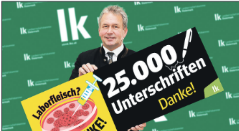
Präsident Franz Titschenbacher bedankt sich bei allen, die die Petition gegen das Laborfleisch unterzeichnet haben.