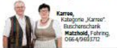
Karrsee , Kategorie „Karnsee“, Buscherschank Matzhoid , Fehring, 0664/9623712