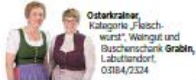
Ostarkraimer , Kategorie „Fleischwurst“, Walgut und Buscherschank Grabln , Labuttendorf, 03184/2324