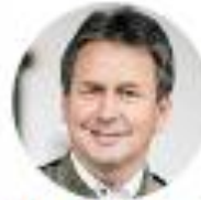
Franz Titschenbacher Präsident der steirischen Landwirtschaftskammer HEILBRUNNEN

Der Klimawandel trifft uns voll! Das gesamte Jahr hindurch hatte die Land- und Forstwirtschaft mit witterungsbedingten Herausforderungen zu kämpfen: Einem zu warmen Winter folgten im Frühling Spätfröste und Starkregen mit Überschwemmungen sowie anhaltende Hitze und Trockenheit im Sommer. Dabei ist es gerade die Land- und Forstwirtschaft, die sehr viel für Natur und Umwelt tut. So haben die steirischen Bäuerinnen und Bauern 23.000 Hektar Biodiversitäts- und Naturschutzflächen angelegt, das entspricht 33.000 Fußballfeldern. Auf 32.000 Hektar, oder 45.000 Fußballfeldern, sind humusaufbauende und bodenschützende Zwischenfruchtbelegungen angebaut. Mit dem Agrarumweltprogramm Öpul setzt Österreich seit 1995 auf eine umweltfreundliche Landwirtschaft – 71 Prozent der steirischen Landwirte nehmen mit 90 Prozent ihrer Flächen freiwillig daran teil. Dennoch sind gerade die Bäuerinnen und Bauern die Hauptleidtragenden des Klimawandels. Sie konnten heuer, begleitet von Hoffen und Bangen, leider nur eine durchwachsene Ernte einfahren. Trotzdem ist jetzt Zeit, Danke zu sagen. Denn gerade ein so schwieriges Jahr macht besonders bewusst, dass eine gute Ernte und hochwertige bäuerliche Lebensmittel keine Selbstverständlichkeit sind.