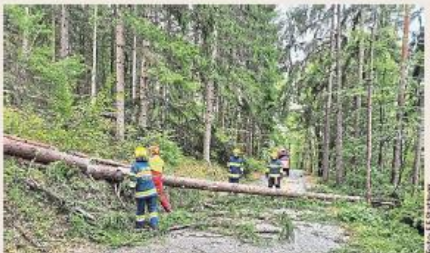
Die Florianis beseitigten unzählige umgestürzte Bäume

Die Landeswarnzentrale appelliert indes weiterhin an die Bevölkerung, „Hausverstand und Vernunft walten zu lassen“. Vor allem in Uferbereichen und in Wäldern, wo die Schäden noch nicht zu 100 Prozent lokalisiert sind, sei Vorsicht geboten. „Sperrungen sind unbedingt ernst zu nehmen, diese wurden nicht umsonst eingerichtet“, sagt Patrick Dörner von der Warnzentrale. HB