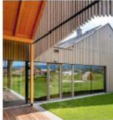
Hurra, unsere Holzhäuschen sind da Kinderhaus Graschuh in Stainz - einzigartiges Holzbauprojekt mit höchstem Wohlfühlfaktor.

Entzückend und hochwertig: sieben Holzhäuschen für die Stainzer Kindergartenkinder