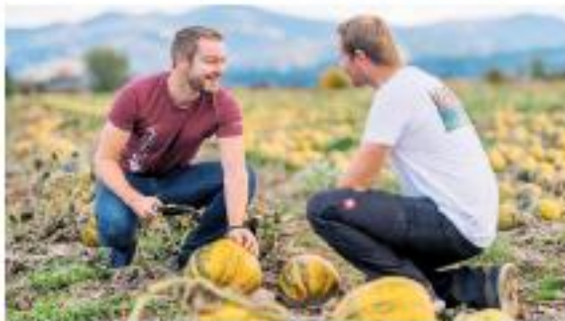
Kürbiskernbauern freuen sich über hohe Qualität der Kerne.

Steirerkraft-Kürbiskernöl g.g.A. ist das meistprämierte Kürbiskernöl der Welt.