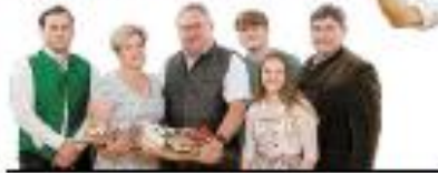
Bauchspeck luftgetrocknet , Kategorie „Luftgetrocknete, ungeräucherter Rohpökelfware“, Kategorie „Rohwurst“, Edle Weiße, Fachschule Hitzendorf , 03135/2252