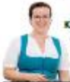
Kräuterkanreespeck , Kategorie „Karnespeck“, Osterschinken , Kategorie „Kochschinken“, Buscherschank Schneeberger , Heimschuh, 03452/83934