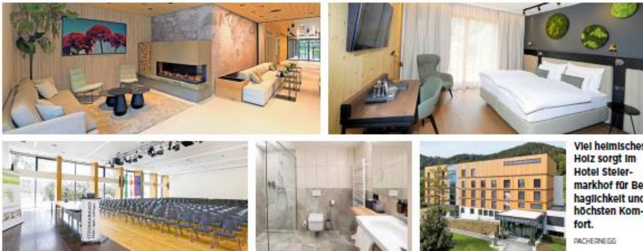
Viel heimisches Holz sorgt im Hotel Steiermarkhof für Behaglichkeit und höchsten Komfort.