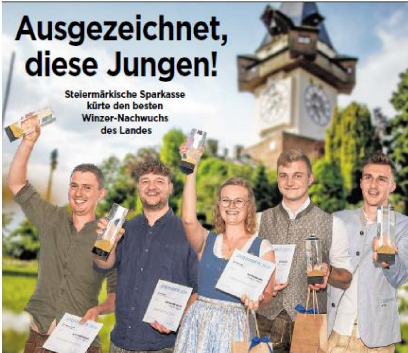
WINNER KRUG, GRAZ TOURISMUS/TONI LARM

Samstag 21. September 2024 www.stmk.lko.at