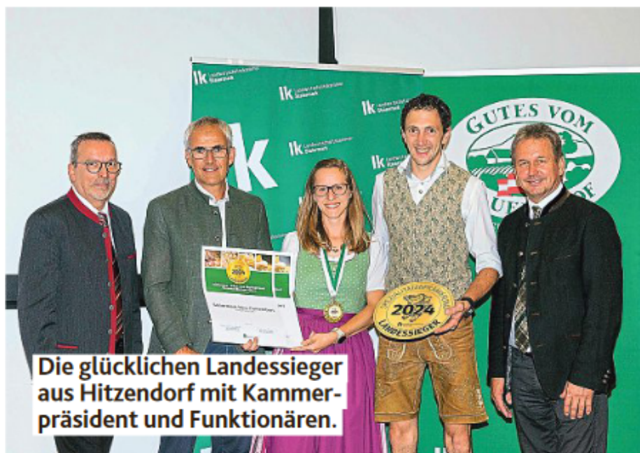
Die glücklichen Landessieger aus Hitzendorf mit Kammerpräsident und Funktionären.

ihre Spezialitäten mit den runden Aufklebern „Landessieger“, „Gold“ oder „Ausgezeichnet“ bei der Steirischen Spezialitätenprämierung 2024 schmücken.