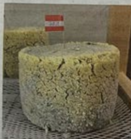
Der Steirerkäse wird aus Magertöpfen erzeugt und hat ein würziges Aroma.