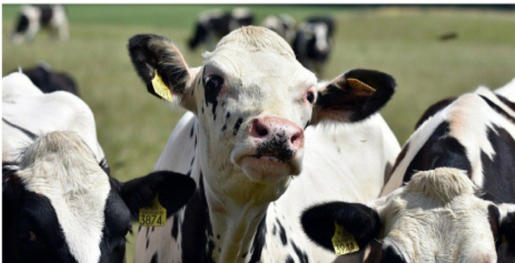
Zwei Betriebe aus Kumberg und St. Radegund konnten bei der Spezialitätenprämierung mächtig abräumen.