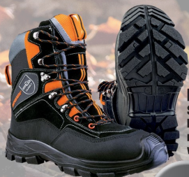
Forststiefel Hunter Schnittschutzeinlage Klasse 1, Atmungsaktiv, mit hohem Tragekomfort, wasserdicht