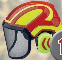
Forsthelm Protos der Forsthelm der Superlative jetzt in Aktion