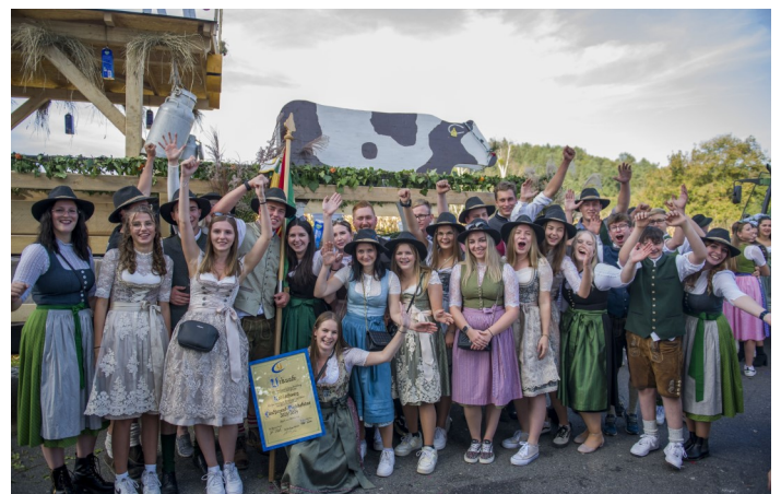
Bericht und Bilder: Landjugend Bezirk Voitsberg

Nach dem fünf verdiente Landjugendliche aus dem Bezirk das Zertifikat „EHREN.WERT.VOLL“ erhalten haben, erreichten wir den Höhepunkt des Tages: Die Verleihung der Bezirksfahne! Diese repräsentiert die außerordentlichen Leistungen unserer Ortsgruppen und wird als Wanderfahne jährlich an die aktivste Ortsgruppe auf Bezirksebene vergeben. Im heurigen Jahr konnte sich die OG Kohlschwarz vor der OG Hirscheegg und OG Stallhofen durchsetzen und darf sich fortan stolz Fahnenträger 2023 nennen.