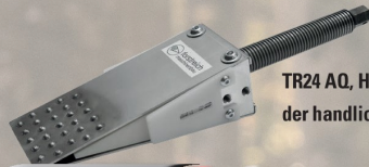
TR24 AQ, Hubleistung 12 Tonnen der handliche Allrounder