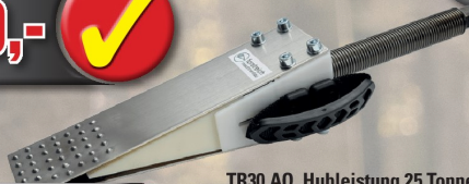
TR30 AQ, Hubleistung 25 Tonnen für die Starkholzernte