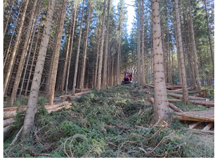
Durchforstungen sollten nicht aufgeschoben werden!

Der Einschlag von Lärchenholz ist aufgrund boykottierter Lieferungen aus Russland besonders attraktiv.