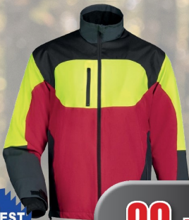
Watex Stretch Forstjackete atmungsaktiv funktionelle Taschen Gr. 48 - 60