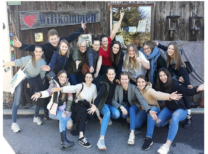
Bericht und Bilder: Landjugend Bezirk Deutschlandsberg

Am Sonntag, den 5. November, hat in Zuge dessen ein Töpferkurs stattgefunden. 15 Teilnehmer:innen aus dem ganzen Bezirk haben sich bei der Werkstätte des Mosaiks in Deutschlandsberg getroffen, um mål wås neix auszuprobieren. Aus unförmigen Tonstücken wurden in den folgenden Stunden weihnachtliche Dekostücke, Schalen, Teelichhalter und vieles mehr geformt.