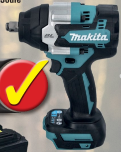
Makita Akku-Schlagschrauber DTW700 Z Schlagenergie 700 Joule 18V