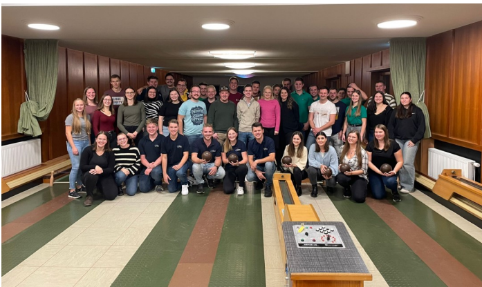
Bericht und Bilder: Landjugend Bezirk Graz und Graz-Umgebung

Wir bedanken uns noch einmal für euer reges Interesse und freuen uns bereits jetzt auf die nächsten Veranstaltungen!