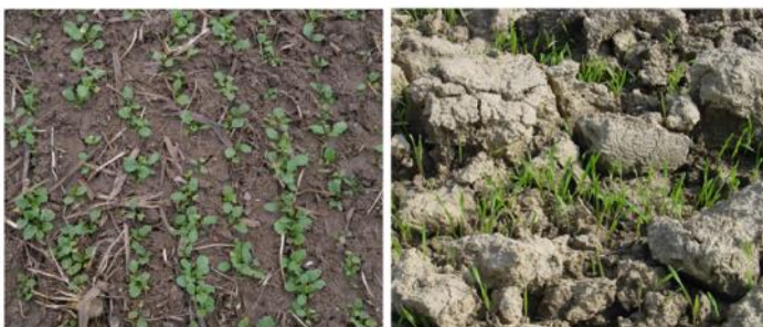
Begrünung m. Perko bzw. Grünschnittroggen-Übersaat

Beispiele für die Mindestbodenbedeckung: