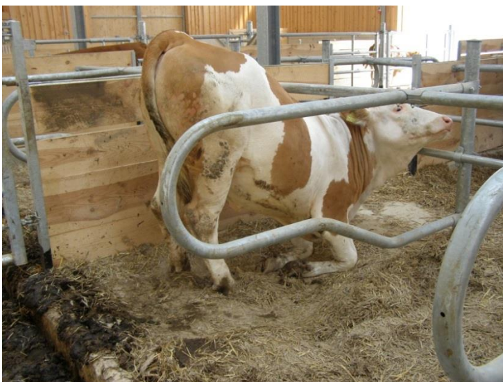
Abbildung 1: Fehlende oder falsch eingestellte Steuerelemente erschweren das Aufstehen der Rinder.